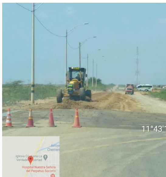
Imagen 2. Mantenimiento de la vía destapada cerca a la Estación de monitoreo Uribí